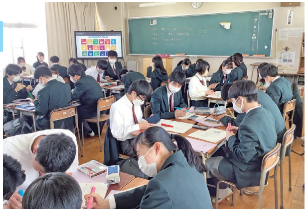
市の広報などを用いてグループで課題を考えよう。