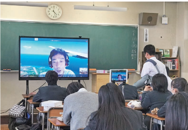
沖縄で暮らす社会人と対話して現代の沖縄の課題が見えてきた。

地元・取手市が抱える課題は、他の地域でも課題なのでは…?取手×My SDGsの時の思考スキルや調査手法を用いて、修学旅行で訪れる沖縄についてグループで探究します。