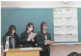
探究の成果を発表。