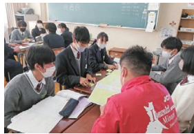
青年会議所や市役所などに所属する社会人の方々との話し合いを通し、課題がジブンゴトになる。