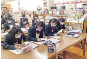
まずは知識から。新書を読む。

地域社会の課題について、それぞれが興味を持つSDGsの視点から見出し、グループで探究していきます。