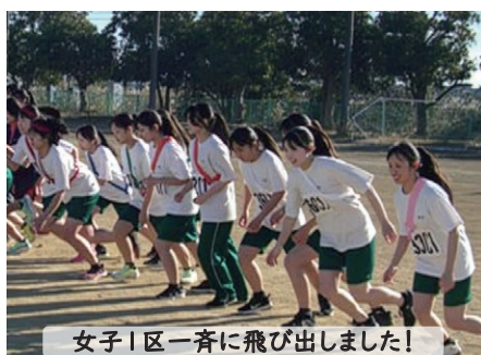
女子1区一斉に飛び出しました!

12月10日(水)駅伝大会が行われました。額に汗を光らせて力走、仲間へと襷を繋ごうとする姿勢に、感動が沸き起こりました。優勝は1年1組。優勝クラスには1人1個あんパンが贈呈されました!