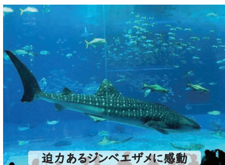
迫力あるジンベエザメに感動