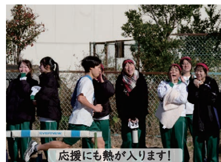
応援にも熱が入ります!