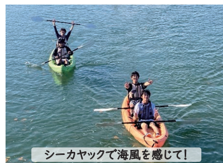
シーカヤックで海風を感じて!