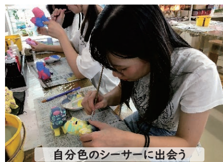
自分色のシーサーに出会う