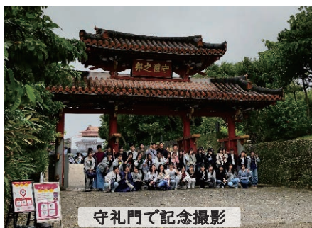
守礼門で記念撮影