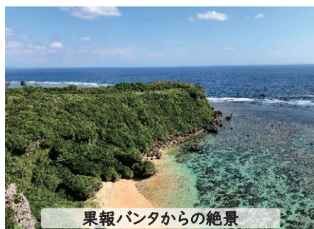
果報バンタからの絶景

2年生が、11月2日(日)～5日(水)、3泊4日の日程で沖縄へ修学旅行に行ってきました。現地では、平和の尊さを学ぶとともに、美しい海と沖縄の人たちの温かさに触れ、充実した4日間を過ごしました。