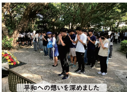
平和への想いを深めました