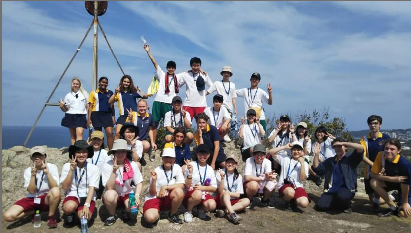
エミュ山頂上にて