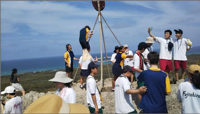
達成感すごいですね。