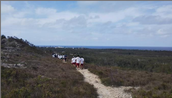
写真を撮った後、今度は降りて行きます。