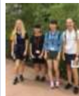
すぐに友だちになりました