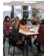
現地生徒と共に学びます 写真は昨年度